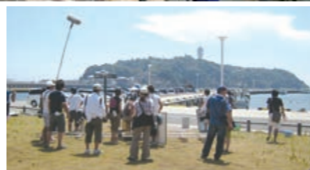
ドラマ「永遠のぼくら sea side blue」撮影風景