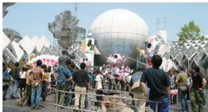
映画「ヤッターマン」撮影風景

多くの市民がボランティアでエキストラ登録し、藤沢市内で撮影されるさまざまな映像作品に出演しています。